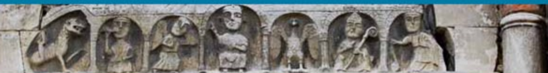
Particolare del portale della Chiesa di San Zenone di Fermo

carifermo casa di risparmio di Fermo s.p.a.