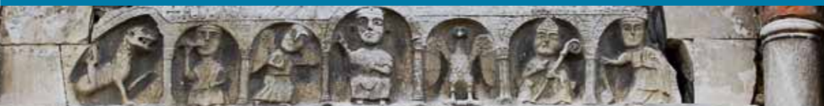
Particolare del portale della Chiesa di San Zenone di Fermo